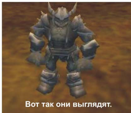
Вот так они выглядят.

Название этого города – Глумвилль. Все гиперборейцы наконец-то узнали, что это за таинственные существа. А это – обычные игроки! Стать орком можно, зарегистрировав нового персонажа, в регистрации выбрать расу – орк. Глумвилль напоминает Каргополь тем, что это тоже город, в котором есть тренировочный центр, библиотека, магазин, источник, и помойка. Должен заметить, в помойке бои проходят и с людьми из Каргополя, то есть помойка объединенная. 777 ответил на это так: «Пусть с детства привыкают». В недалеком будущем орки и люди будут биться друг с другом, причем бои будут кровавые. Конечно орки не такие сильные, как люди, поэтому